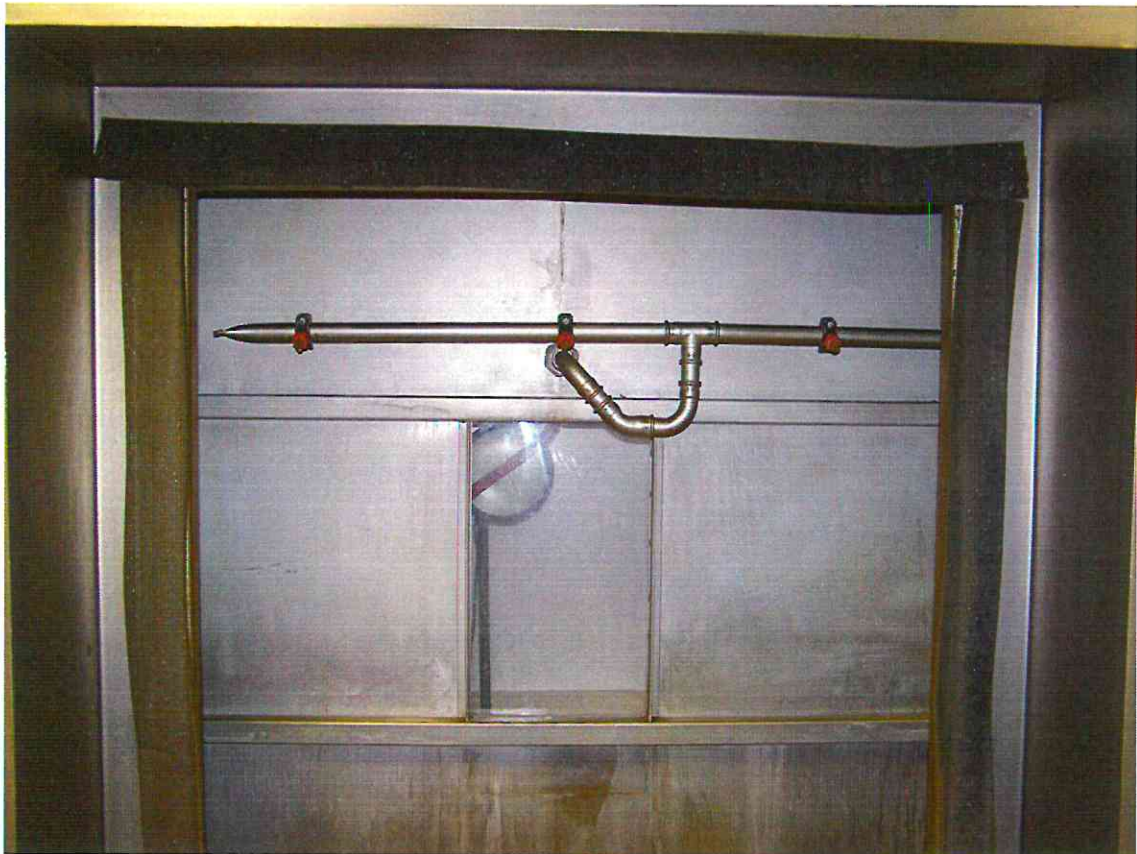
Bild 2: Offener Prüfstand mit Anordnung der drei wassersprühenden Düsen