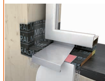
Zum zusätzlichen Schutz der horizontalen Tragwerkskonstruktion (Riegel, Ständerwerk) im Holzbau.